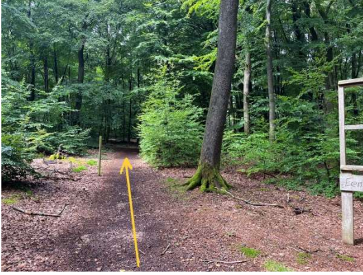
18 Nom leschten Hinweis bleiwe mir um Bëschpad a ginn weider riichtaus.