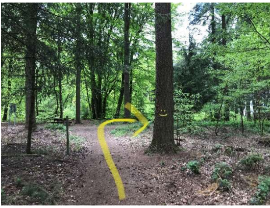
20 Beim Start, riets bei de Parking goen.