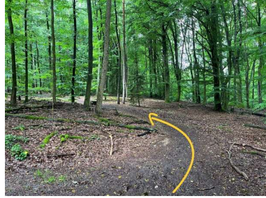
19 Mir bleiwen ëmmer um Bëschwee, deen hei liicht lénks ofbéit.