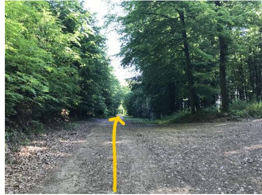
26 Laanscht d'Picknickplaz goen...