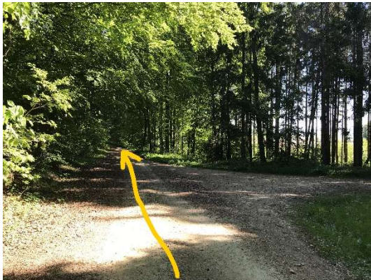
27 an dee selwechte Wee zrëck goen: bei dëser Kräizung lénsks halen.