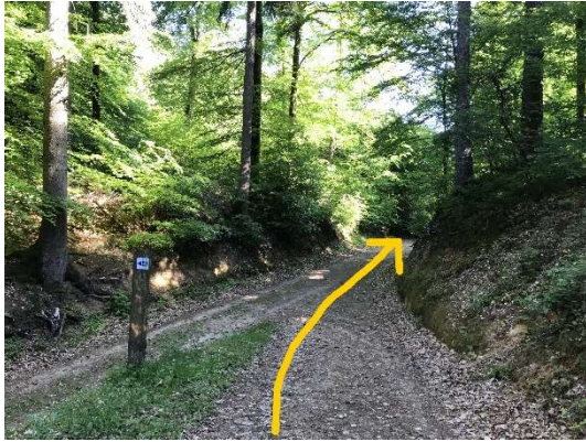
25 Och hei, riichtaus trëppelen.