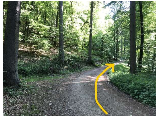
28 Och hei um Wee bleiwen.